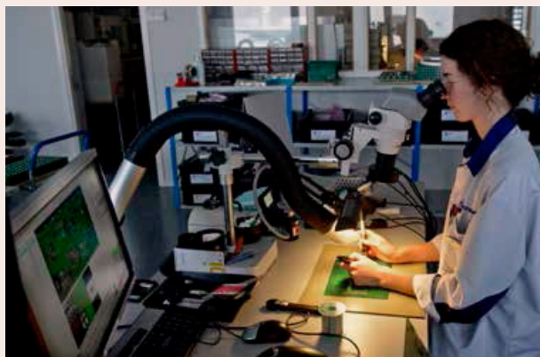
UTRUSTAD. Det krävs skyddsrock och skyddsskor för att gå in i produktionen. Det känns som att kliva in i ett laboratorium.